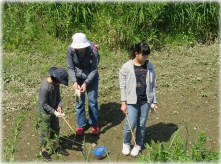
クロベンケイガニ釣り