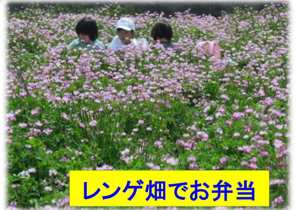
レンゲ畑でお弁当