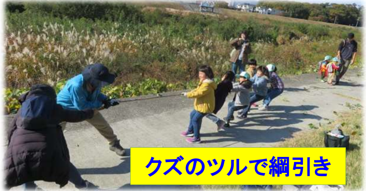
クズのツルで綱引き