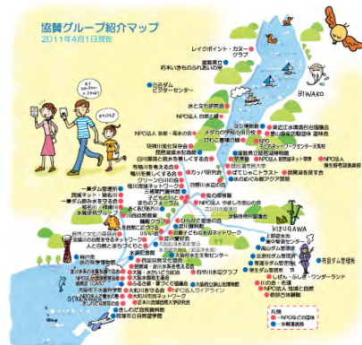
〔BYスタンプラリー協賛グループマップ〕