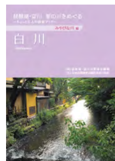
琵琶湖・淀川里の川をめぐる