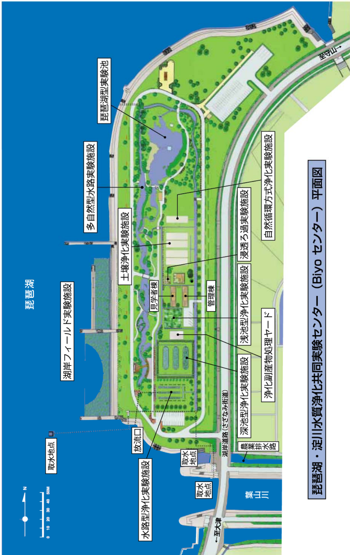
琵琶湖・淀川水質浄化共同実験センター (Biyo センター) 平面図