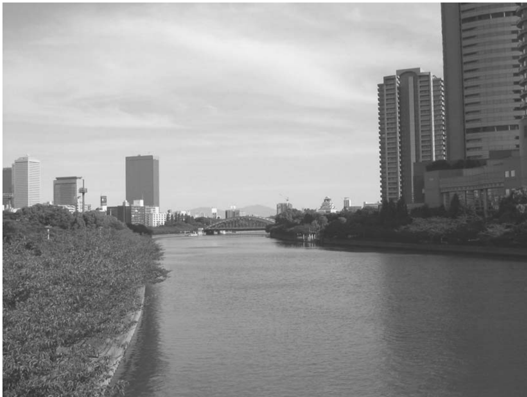
【大阪市内河川（大阪城付近）】

大阪市内河川のBOD（75%値）は昭和40年代中頃まで非常に高い値を示していたが、その後は改善傾向を示している。平成18年度は、神崎橋で2.0mg/l（環境基準値3.0mg/l）であり、環境基準値を満たしている。一方、京橋は8.3mg/l（環境基準値8.0mg/l）、天神橋（堂島川）は3.1mg/l（環境基準値3.0mg/l）、天神橋（土佐堀川）は5.6mg/l（環境基準値5.0mg/l）であり、環境基準値を上回っている。