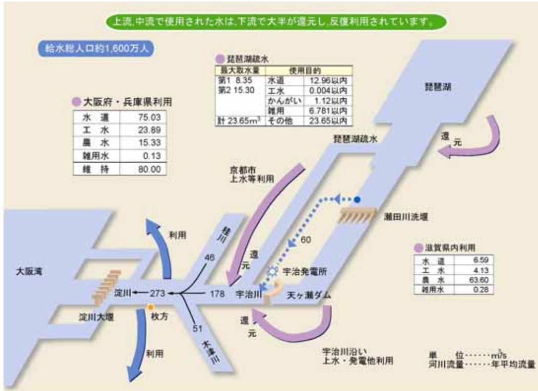
【図1 - 13 琵琶湖・淀川水系の水利用（2006年3月末現在）】