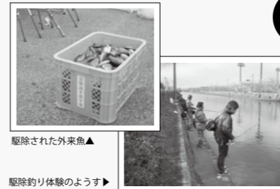
駆除された外来魚▲